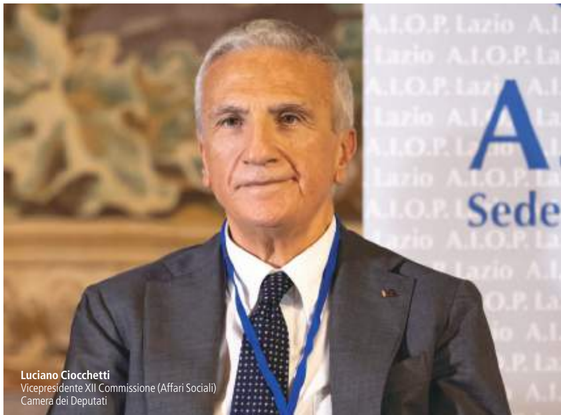
Luciano Ciocchetti Vicepresidente XII Commissione (Affari Sociali) Camera dei Deputati

le tradizioni, che ci sia ancora un'identità molto forte, però ci occupiamo delle aree interne quando nelle aree interne arriva qualcuno che fa il lavoro sporco, quello definitivo. C'è stato il depauperamento demografico, non c'è più tanta economia, poi arriva un terremoto, arriva un'esondazione e allora ci occupiamo delle aree interne.