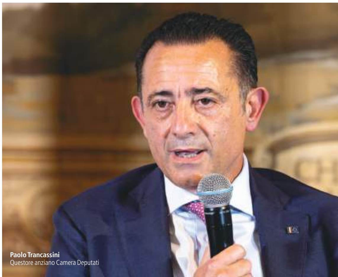
Paolo Trancassini Questore anziano Camera Deputati