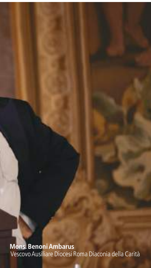
Mons. Benoni Ambarus Vescovo Ausiliare Diocesi Roma Diaconia della Carità

cietà degna di questo nome, cadere nella trappola de gli ultimi saranno ultimi , ma va recuperato questo principio, al di là che lo dica il Vangelo. La dignità e la civiltà di una società si possono misurare da poche cose vere: il primo criterio, come diceva Dostoevskij, si misura dal grado e dal modo in cui vengono gestite le carceri; il secondo, dal grado e dal modo in cui vengono gestiti gli ultimi e i più fragili; il terzo, dal grado e dalla sensibilità nel riconoscere pari dignità a tutti i membri della società.