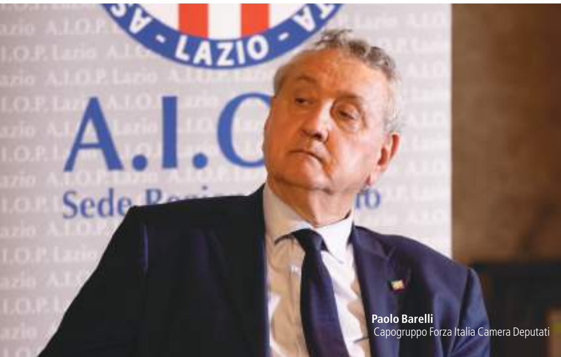
Paolo Barelli Capogruppo Forza Italia Camera Deputati